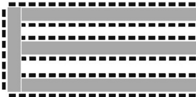
Ryc. 2 Schemat alternatywnego ustawienia miejsc w sali konferencyjnej.